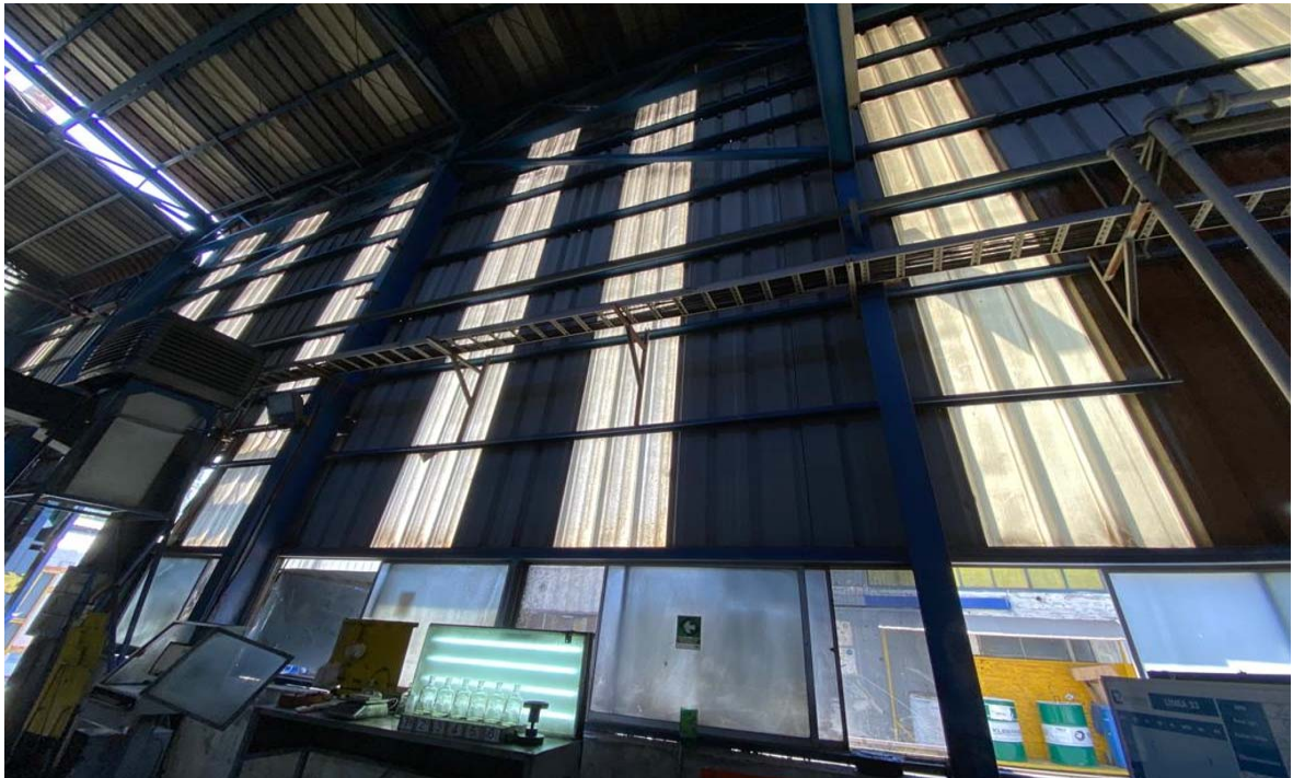
Imagen n°2: Vista de muro en zona caliente, sector automáticas IS a mejorar.